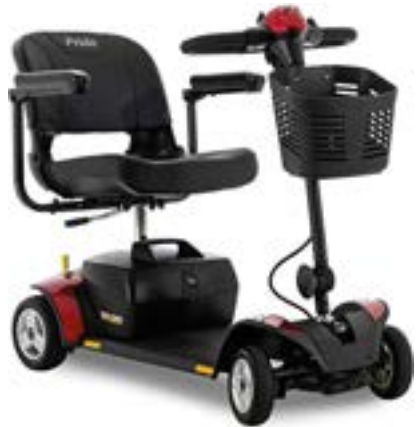
SCOOTER DE MOVILIDAD DE 4 RUEDAS GO-GO ULTRA X