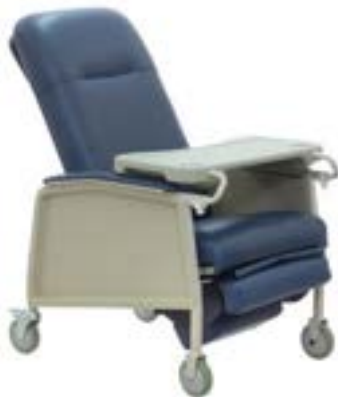
SILLÓN REPOSIT REACTIVO TIPO HEMODIALISIS CON CHAROLA DESMONTABLE Y RUEDA DE 5"

Si buscas un modelo en específico y no lo ves aquí, llámanos y te lo conseguimos.