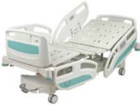
CAMA AUTOMÁTICA ELÉCTRICA DE LUJO AOLIKE P-TRENDELEMBURG DE 5 POSICIONES